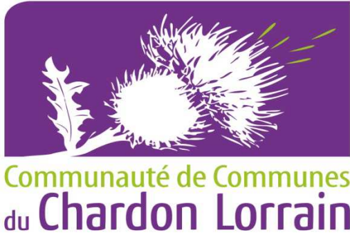
Schéma de mutualisation