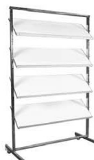
Porte brochures expo doc blanc 1,25 x P.100 x H.162 70,00€ HT