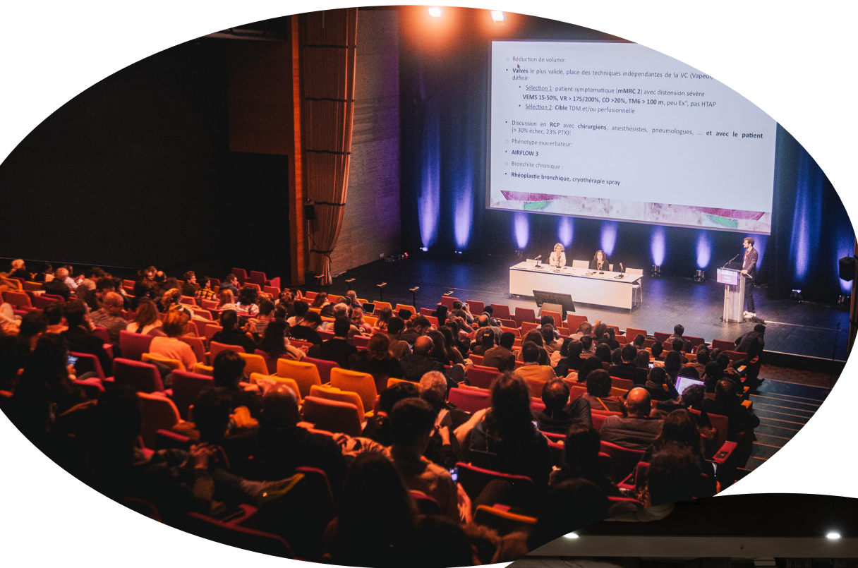
Théâtre Louis Pasteur