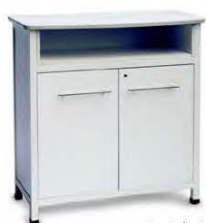
Comptoir only blanc 1150 x P.75 x H.111 56,00€ HT