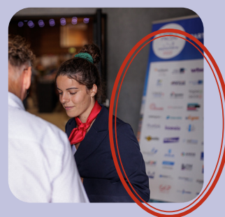
Logos sur Kakémono