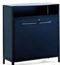
Comptoir only noir 1150 x P.75 x H.111 56,00€ HT