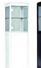
Vitrine dell blanc 1,50 x P.50 x H.180 207,00€ HT