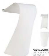
Pupitre switch led blanc 181 x P.58 x H.120 194,00€ HT