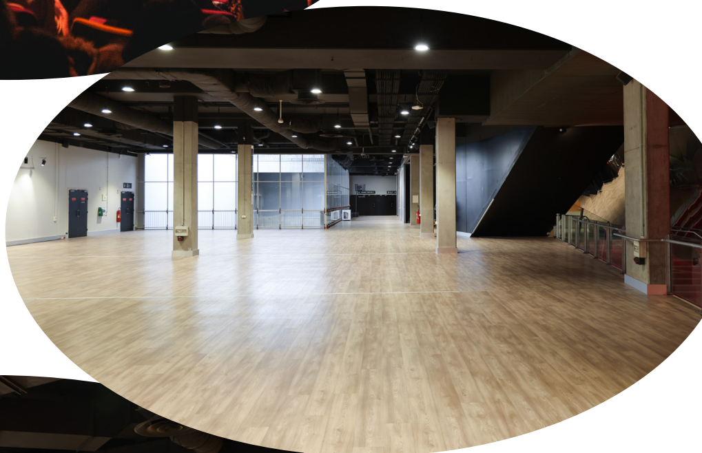
Espace Le Square