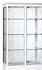
Vitrine Rubia Monet blanche ou noire 150 x P.24 x H.115 35,00€ HT