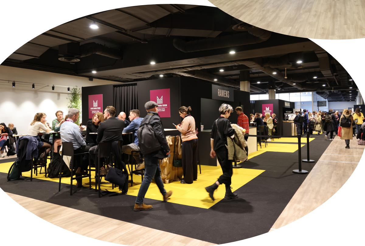
Espace Le Square