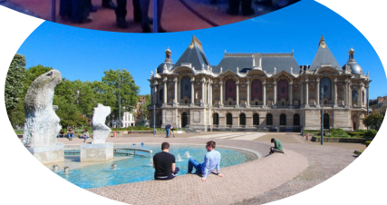
Palais des Beaux-Arts