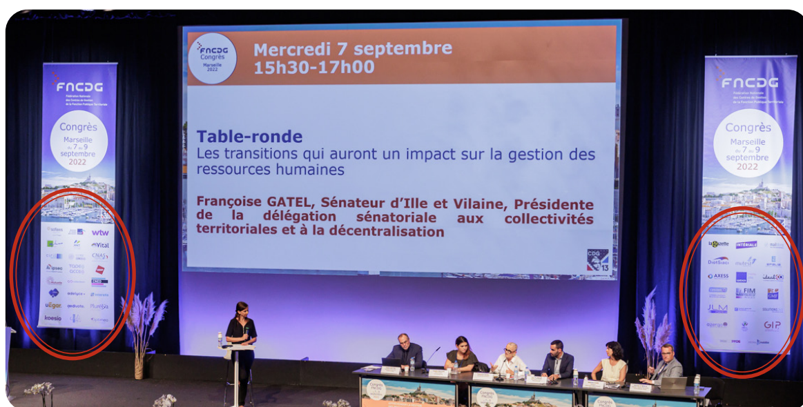
Logos sur les bâches de l'auditorium