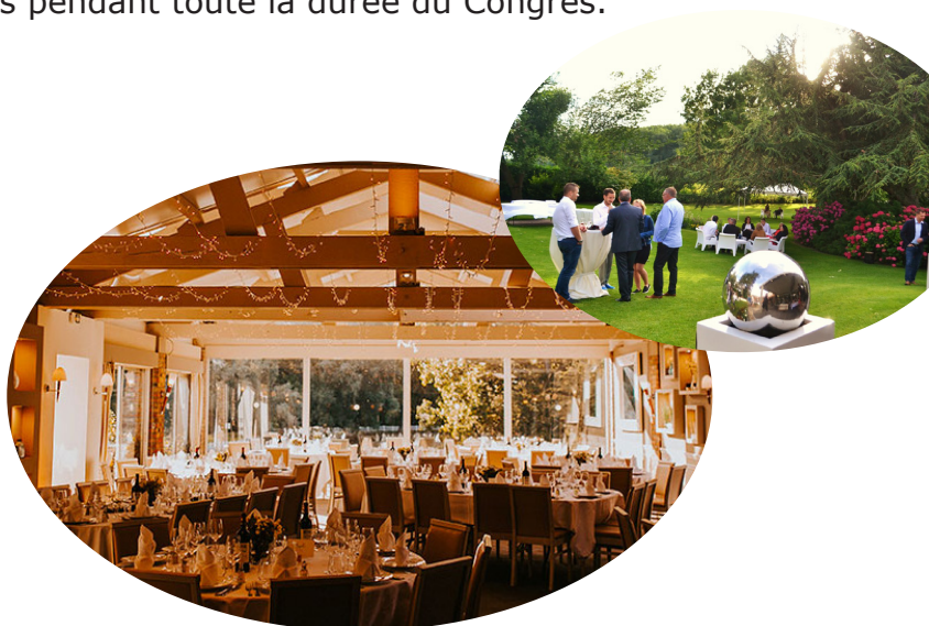
Domaine de la Chanterelle